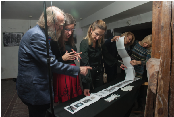
Wernisaż „Metamorfozy, Odsłona 1”.