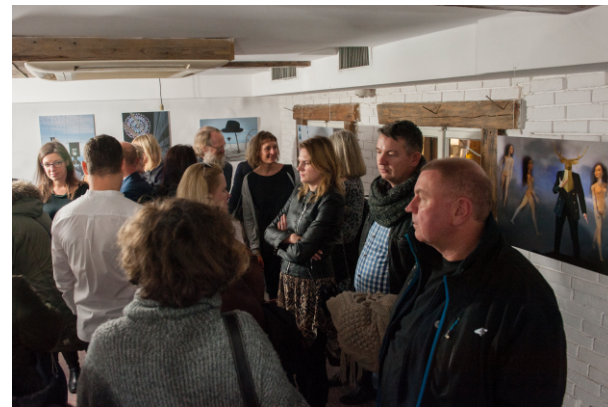
Wernisaż „Metamorfozy, Odsłona 1”. Fot. Andrzej Hajdasz