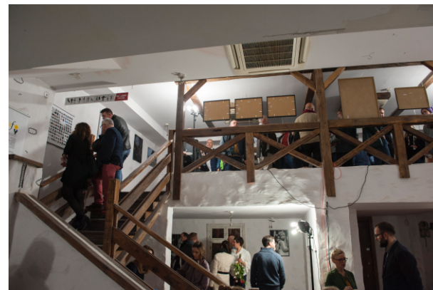
Wernisaż „Metamorfozy, Odsłona 1”.