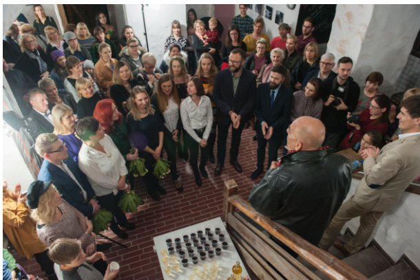
Wernisaż „Metamorfozy, Odsłona 1”.