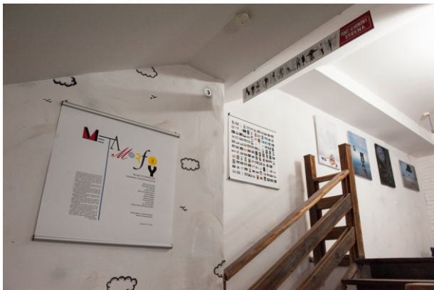
Wernisaż „Metamorfozy, Odsłona 1”.