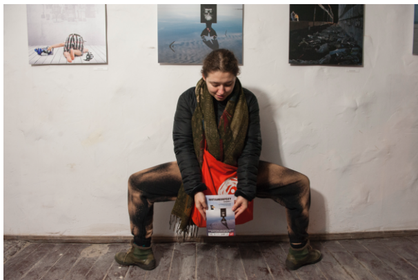
Wernisaż „Metamorfozy, Odsłona 1”.